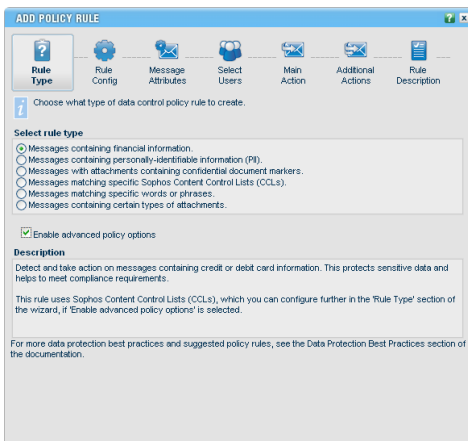
Sophos E-Mail Appliance DLP-Assistent

Maßnahmen: Am Endpoint kann das Ereignis optional protokolliert, der User durch eine Bildschirmanzeige gewarnt und zum Handeln aufgefordert oder aber die Transaktion protokolliert und blockiert werden. Auf der E-Mail Appliance können Inhalte vor dem Senden protokolliert, in die Quarantäne verschoben, blockiert oder verschlüsselt werden.